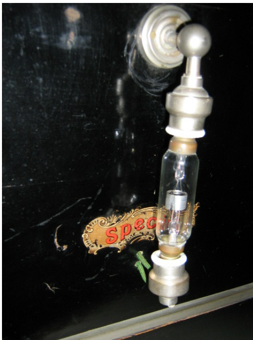
De ophanging van de Holland buislamp

Recent is dit toestel opgedoken van Radio Bussum met een Holland / Erbee lamp. Dit toestel is een eenvoudiger uitvoering (zonder golflengteschakelaar) van dat op de vorige bladzijde, die immers bedoeld was voor o.a. de dagbladen (nieuwsgaring).