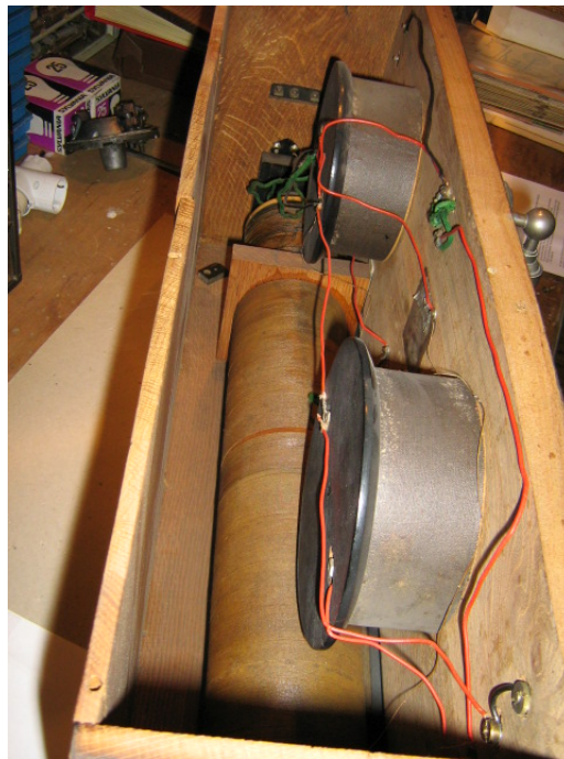
De binnenzijde van het toestel bevat twee spoelen met een schuifcontact en twee afstemcondensatoren.

Het is dan ook heel waarschijnlijk dat eind 1918 Radio Bussum al toestellen verkocht met Holland buislampen.